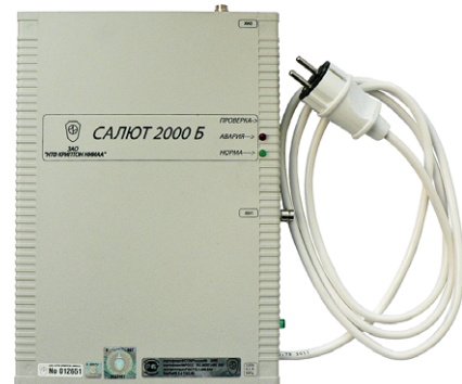
Салют 2000 Б

- от утечки за счет наводки информативного сигнала в токопроводящие цепи, выходящие за пределы контролируемой зоны, путем создания с помощью направленного ответвителя (в комплект поставки не входят), в токопроводящих цепях, выходящих за пределы контролируемой зоны, напряжения маскирующего шума. Изделие «Салют 2000 Б» может устанавливаться в выделенных помещениях по 1 категорию включительно, в том числе оборудованных системами звукоусиления речи.